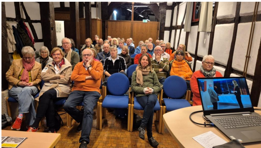
Multimedia-Vortrag „Das Sinalco Musical – Dichtung oder Wahrheit“