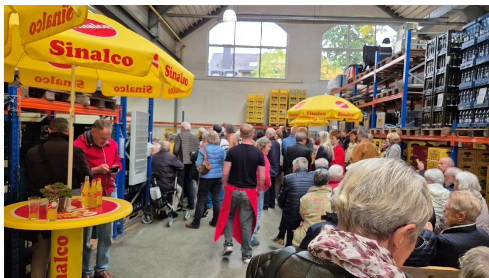
Großes Interesse für die Theatermatinee